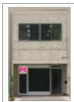
大阪試験センター